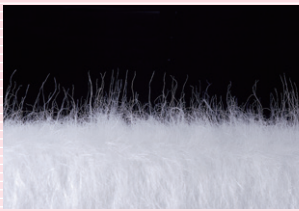
静電気により立ち上がった長い毛足

静電気ので、細菌レベルの微細なダストから土ぼこり・毛髪まで強力に吸着。さらに長繊維を用いた独自のパイル構造がダストを内部に閉じ込め、ホールドします。高い捕集性能で作業がより効率的に！