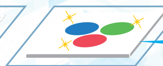
◎透明感が高く膜厚が厚い場合