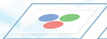
透明感が高く膜厚が薄い場合