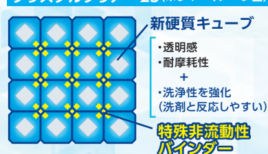
クリスタルクリアー25(ポリマーイメージ図)

塗膜に汚れを抱き込むことが少なく、表面洗浄の作業効率UPやハクリ作業周期の延長も可能です。